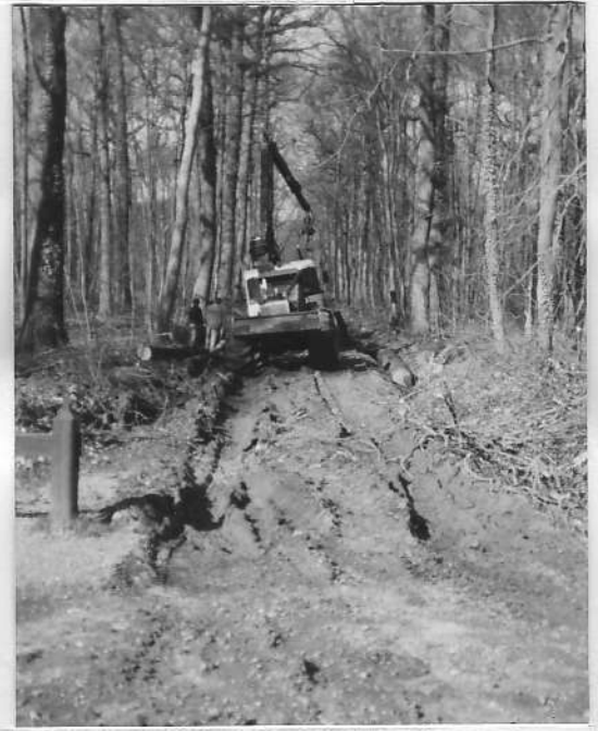
L'ONF à l'ouvrage en forêt de Meudon.