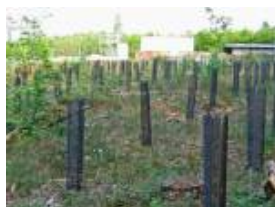
L'état de la parcelle 67 en 2008(JPEG, 148.6 ko)

On ne peut hélas que déplorer le manque de sérieux du gestionnaire dans le suivi des travaux qu'il confie aux employés qu'il a engagés.