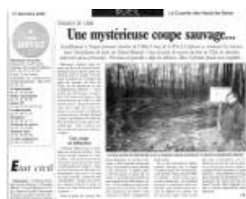
L'article paru il y a 8 ans.(JPEG, 146.5 ko)