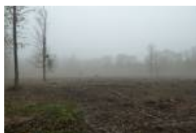
PJ 600(JPEG, 150.4 ko)

Pour voir la photo en taille réelle, double-cliquez sur la vignette :