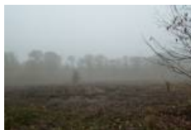
PJ 602(JPEG, 150.6 ko)