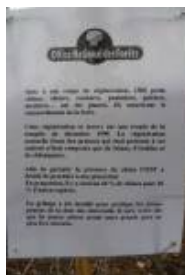
PJ 605(JPEG, 551.7 ko)