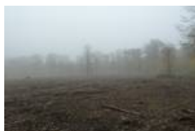
PJ 601(JPEG, 140.8 ko)